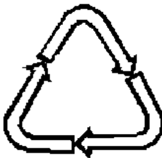
Рисунок 2 для парфюмерно- косметической продукции